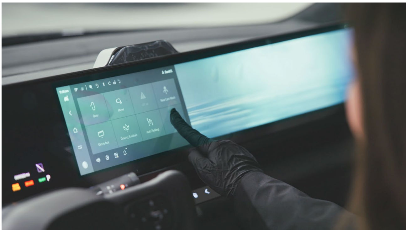
AFEELA 1の車載インフォテインメントシステムの動作を Quality Gate で検査

「私たちは、AFEELA が約束する『体験』をお届けするために、搭載されているすべての統合機能が、設計通りに完全に動作することを確認します。テクノロジーだけではなく、最高の信頼性も提供する。これが、私たちのお客様へのコミットメントです。」