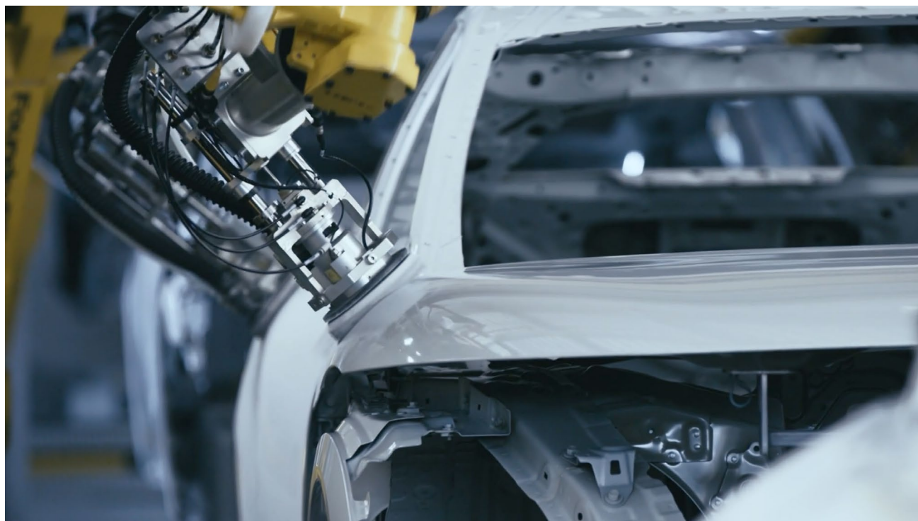
塗装工程に新規導入されたロボットが AFEELA1 の下地を磨いている様子

AFEELA には、従来の自動車に求められる厳格な製造品質、車両に搭載されている 40 個のセンサー、パノラミックスクリーンと各種アプリ、AI や通信といった高度なテクノロジーの統合が求められます。当社では、要求仕様に基づき Honda の厳格な品質基準に基づき生産された車両を受領後、「Quality Gate」にて更なる品質検査を独自に行い、AFEELA の目指す品質を確かなものとします。