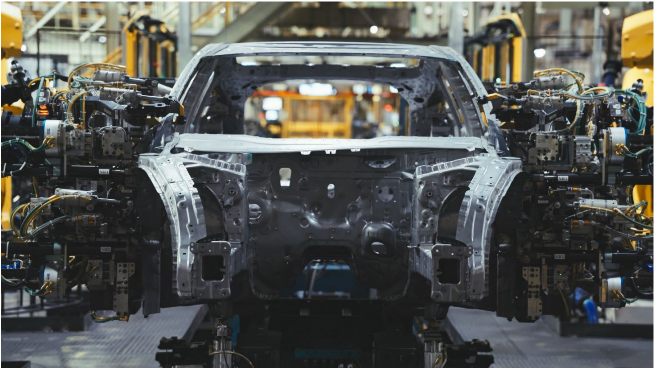
生産ラインで AFEELA 1 のホワイトボディにドアパネルを組み付けるロボットの様子

- 量産開始に向けて米国オハイオ州に AFEELA 独自の品質検査施設を設立 -